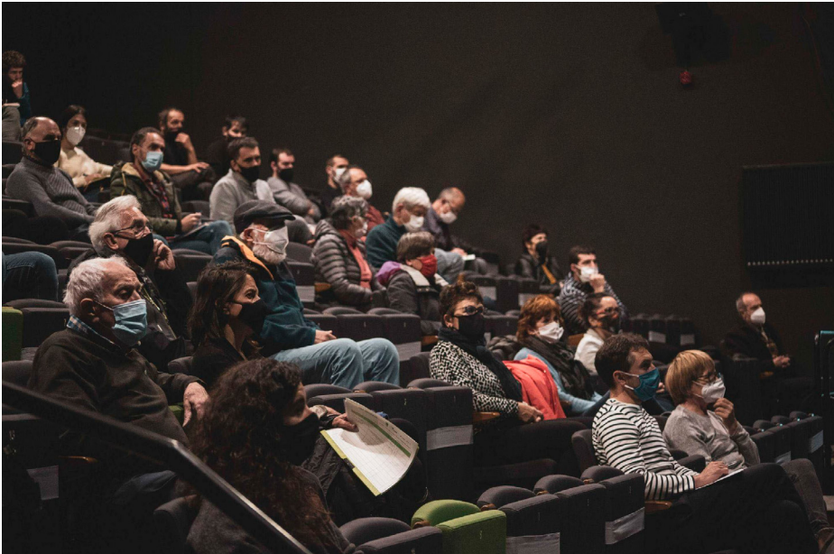
Jende-aurreko aurkezpen publikoa 2021ko udaberrian