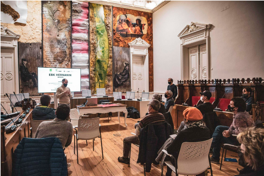
Saio bateko bilera Hernaniko udalbatza aretoan

Talde sustatzailea 2021ko urtarriletik 2022ko martxora arte lanean egon da, Komunitatea eratu den arte. Horretarako saio mota asko izan dira; informazioa jasotzeko, erabakiak hartzeko.